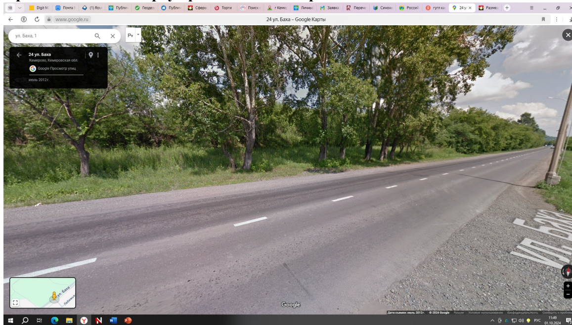
Схема размещения земельного участка, с указанием ключевых элементов инфраструктуры: